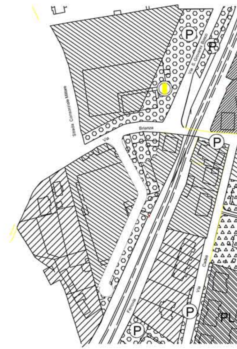
AZZONAMENTO IN VARIANTE AL P.R.G. COMUNE DI LAMBRUGO (CO) CONSEQUENTE AL PIANO INTEGRATO DI INTERVENTO 1:2000