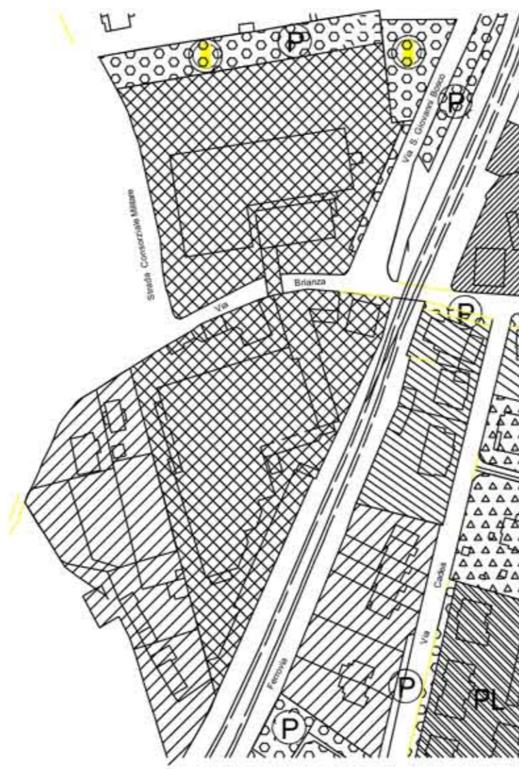
ESTRATTO P.R.G. VIGENTE COMUNE DI LAMBRUGO (CO)